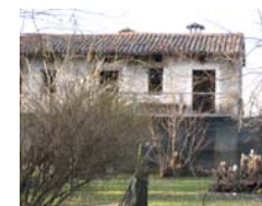
Il casale, luogo dei sogni in un giardino incantato d'altri tempi...