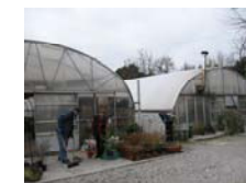
Il grigio dei teloni delle serre protegge e nasconde un mondo di colori e profumi...