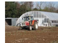
Primavera incalza, la terra va preparata...