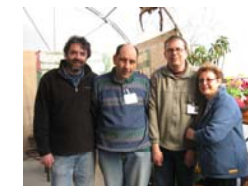
Una meritata pausa in serra mentre si prepara la festa scozzese...